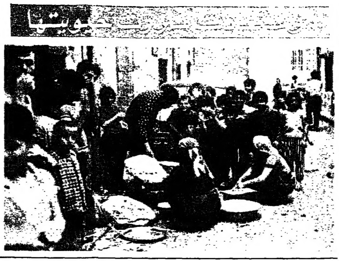
معلومات فرنسية جديدة عن اللبناني القاتل بباريس